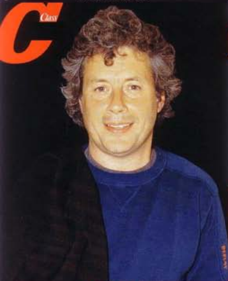
IL REGISTA ALESSANDRO BARICCO