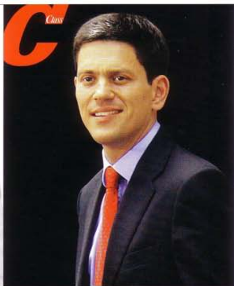
IL POLITICO DAVID MILIBAND