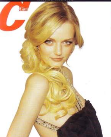
LA TOP MODEL LYDIA HEARST