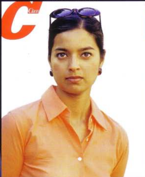
LA SCRITTRICE JHUMPA LAHIRI