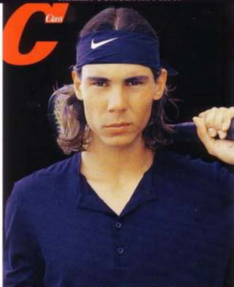
IL TENNISTA RAFAEL NADAL